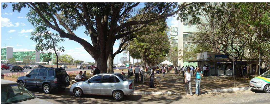
Fig. 2. Um dos trechos mais ativos da Esplanada num dia de semana

As atividades acrescentam à formalidade do lugar uma atmosfera interessante (Fig. 2). Sem elas, o espaço público estaria deserto, exceto nos momentos em que as pessoas chegam e saem do trabalho. Com elas, milhares de pessoas ocupam o lugar nas horas mais movimentadas do dia. Todavia, em vez de se inspirarem nesta interessante indisciplina do homem comum (CERTEAU, 2000), pela qual pessoas comuns contribuem para um uso popular do espaço, o governo reprime a iniciativa. O argumento é recorrente: essa informalidade contradiz as regras de preservação. Nunca é dito em que termos, ou se diferentes soluções seriam aceitáveis, de acordo com aquelas mesmas regras. A proposta original de Lucio Costa, mais uma vez, é desconsiderada.