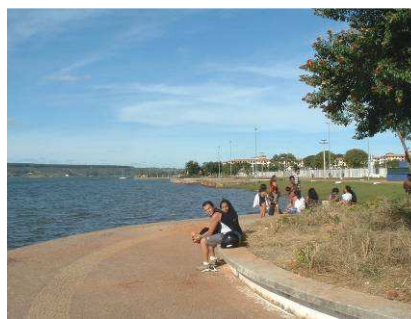
Fig. 9. Apropriação popular das margens do lago