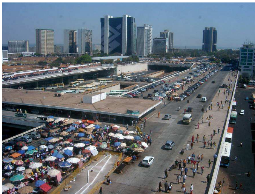
Fig. 4. A Plataforma Rodoviária antes de os vendedores ambulantes serem removidos (2007)

Em maio de 2008 os ambulantes foram removidos para um “shopping popular” – contradição em termos – num local isolado, por onde ninguém passa. Resulta que, mais de dois anos depois da remoção, o local está 70% vazio. E, como seria de esperar, os ambulantes estão retornando à anterior localização, apesar da forte repressão.