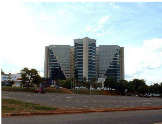
Fig. 5. Setor Comercial Norte

Bem próximo à Plataforma Rodoviária, onde ocorre essa tensão permanente quanto aos vendedores ambulantes, constrói-se o Setor Comercial Norte (Fig. 5). Como no Conjunto Cultural da República, o lugar não poderia ser mais inóspito, com um agravante: não está na escala monumental, mas na gregária, onde supostamente deveria haver lugares para convidativa apropriação pelos mais amplos segmentos sociais. Se na monumental ainda poder-se-ia argumentar (erroneamente) que se trata de espaços simbólicos , aqui nem isso. O espaço em tudo contraste com seu irmão sulino (o Setor Comercial Sul), onde uma intensa apropriação pelos pedestres ocorre (pelo menos durante o dia, pois ela morre ao cair da tarde). Os edifícios são introvertidos, têm uma única, ou muito poucas portas para o exterior, e são cercados por mares de estacionamentos. Nada mais impróprio para o gregarismo no âmbito público.