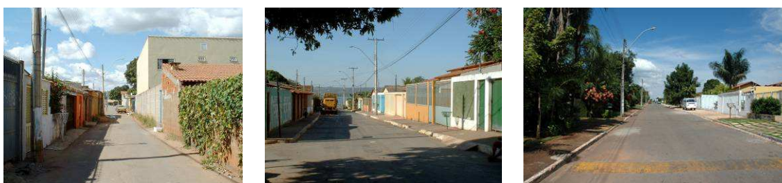
Fig. 6. Variedade edilícia e urbana na Vila Planalto

O fascinante exemplo da Vila Planalto é execrado por arquitetos e governo por igual. O lugar é remanescente de um acampamento de obras, lugar de extrema variedade edilícia e urbana (Fig. 6). Surpreendentemente, a Vila apresenta a mesma estratificação social do DF como um todo: é um microcosmo da metrópole. Entretanto, ela é considerada “fora de contexto” – Lucio Costa queria escondê-la com vegetação – e não mereceria estar onde está por não ser “esteticamente qualificada”. Decerto a Vila não é o suprasumo da beleza. Mas isso não está em jogo nem está sendo discutido aqui. Está em jogo a congruência entre certos atributos arquitetônicos ( lato sensu ) e a presença de uma estratificação social variada. A Vila exemplifica-o por excelência. Ela mostra como o “repertório superquadra” nunca poderia abrigar todo o espectro social; mostra que, se queremos uma cidade justa para o aqui e o agora, há que admitir tipos edifícios e urbanos congruentes com o poder aquisitivo da população – em todo o seu espectro.