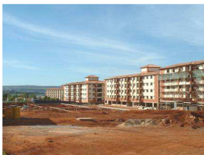
Fig. 8. Condomínios fechados de luxo cada vez menos disfarçados de hotéis