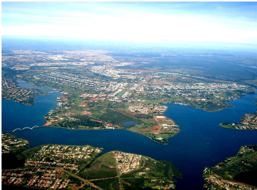
Fig. 7. A escala bucólica está, p.ex., a leste das Asas Residenciais do Plano Piloto (parte de ocupação rarefeita no centro da figura, às margens do lago)

Como na fábula do lobo e do cordeiro: contra a força do argumento, o argumento da força.