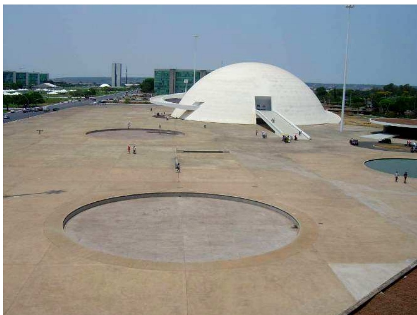
Fig. 3. Museu Nacional Honestino Guimarães, do Conjunto Cultural da República

O que se permite apenas contribui para aquilo que a repressão implica. Permitem-se novos projetos que não definem um espaço público de qualidade, onde se possa sentir tudo, menos o aconchego dos lugares abertos próprios ao convívio nos centros das cidades. Permite-se um Conjunto Cultural da República, em tudo oposto aos atributos de transparência e abertura para com o espaço público aberto, característicos da arquitetura clássica dos palácios de Brasília (Fig. 3), e em tudo oposto à descrição do Relatório do Plano Piloto para a área (Lucio Costa: “... setor cultural, tratado à maneira de parque para melhor ambientação dos museus, da biblioteca, do planetário, das academias, dos institutos etc.”) (COSTA, 1957, 1995). A sensação de aridez e desconforto é patente, não apenas por falta de vegetação, como alguns argumentam. Espaços minerais aconchegantes abundam na história – vide a Praça Tiradentes, em Outro Preto, e tantas outras, no Brasil ou alhures, como as que faziam as delícias de um Camillo Sitte. Não, o problema é morfológico, refere-se às grandes dimensões do lugar e ao fato de os edifícios não definirem, por causa de suas formas convexas (circulares em planta), claras unidades de espaço aberto dentro das quais nos sintamos, e porque são ofuscantemente fechados e opacos em suas amplas superfícies de concreto pintado de branco.