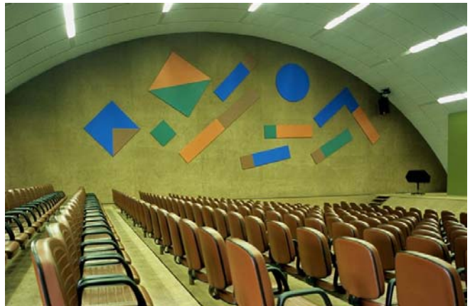
Figura 08: No Sarah de Fortaleza, são formas geométricas que dançam sobre a parede do auditório.

Lelé sempre quebra a monotonia de grandes superfícies neutras com um elemento decorativo. No auditório do hospital Sarah de Fortaleza (2001), Athos faz dançar sobre a parede lateral enormes círculos, triângulos, retângulos e quadrados multicoloridos. No auditório do hospital Sarah do Lago Norte em Brasília, são as meias-luas verde-água que parecem barquinhos a navegar sobre a superfície azul do mar.