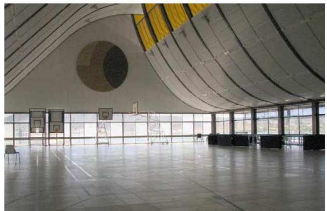
Figura 10: Athos sempre interfere nas grandes empenas, como no ginásio do Sarah do Lago Norte.

No hospital Sarah do Lago Norte, a obra de Athos está muito presente. Pode-se vê-la na parte superior da empena dos grandes ginásios de fisioterapia e no painel de lâminas pivotantes multicoloridas. Lelé explica a Athos que a parede em questão isola a fisioterapia da circulação, logo tem de ter uma transparência e possibilitar a ventilação. Percebendo o objetivo do projeto,