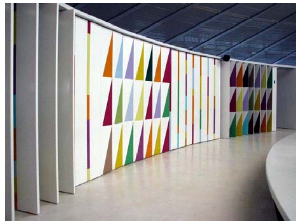
Figura 12: As bandeirolas multicoloridas transformam em espaço recreativo o Centro de Reabilitação Infantil do Sarah do Lago Norte.

Lelé 14 costuma dizer que imagina a arquitetura como um processo que se desenvolve ao longo do projeto, da obra, e que se define quando o usuário começa a ocupar o espaço e usá-lo. Então, ela deve ser bela como todas as manifestações do ser humano. Pensar que beleza não é função é um equívoco: ela deve ser alcançada através da técnica e de todos os saberes que a arquitetura exige.