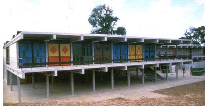
Figura 03: Painéis com desenhos geométricos africanos constituem os fechamentos nas escolas em argamassa armada em Salvador.