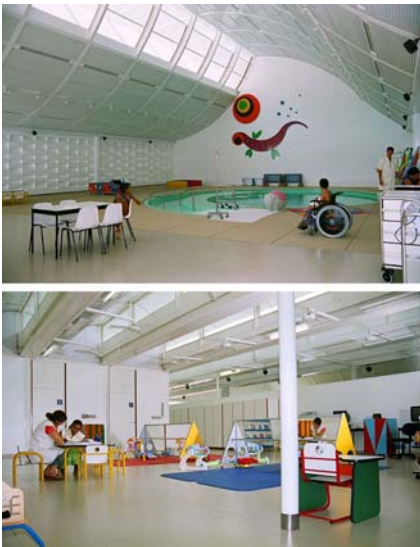
Figura 17: A lagarta vermelha que Lelé desenha para o Sarah de Macapá alegra a sala de hidroterapia.

necessário um elemento rústico que criasse uma divisória, algo que alegrasse o ambiente” 16 , explica ele.