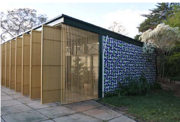
Figura 02: Segundo módulo da residência Aloysio Campos da Paz, com os painéis pivotantes amarelos e fachada lateral recoberta de azulejos do Athos.

A arquitetura de Lelé, trabalhando o concreto armado e protendido, cria volumes ousados, de grande impacto visual. Na Residência José da Silva Neto, realizada em 1974 em Brasília, ele eleva a casa de 6 m em relação à cota mais alta do terreno, situando-a acima da copa das árvores. A área de serviço, alocada no térreo, completamente murada, é revestida externamente por azulejos de Athos, que lhe confere leveza, ressaltando a estrutura como elemento forte da construção. Pelos reflexos, vazamentos ou pelo movimento que cria, os azulejos originam superfícies de pouca densidade, que valorizam as adjacentes, no caso a estrutura. Neste projeto, com cores vibrantes - o verde, o azul e o branco -, e um padrão composto por triângulos, Athos nos dá a sensação que as bandeirolas voam, como se saídas de um quadro de Alfredo Volpi.