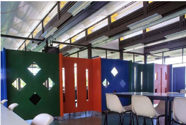
Figura 05: Painéis em madeira colorida no Sarah de Salvador.

em uma ala dos quartos, criou painéis constituídos por módulos coloridos, com pequenas aberturas, que entram em comunicação direta com os jardins. Na sala de espera da Radiologia, utilizou as cores amarela e laranja, em fundo branco, para provocar a sensação de alegria e bem-estar. 12