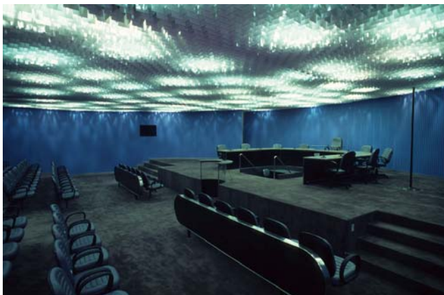
Figura 15: Auditório do TRE-BA: frisos azuis contornam as paredes, sendo iluminados por bolas luminosas que se formam na cobertura.