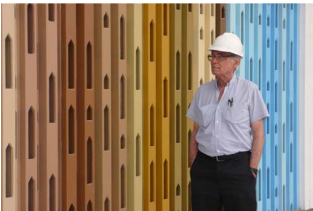
Figura 19: o arquiteto posa ao lado de seu painel artístico no Sarah do Rio de Janeiro.

Com o avanço da doença de Parkinson, Athos perdeu o controle motor, a percepção das cores e deixou de produzir. O Hospital Sarah do Rio de Janeiro (2001-2009), recentemente inaugurado, é o primeiro projeto que Lelé não pôde contar mais com o amigo debilitado. Numa homenagem ao mestre e amigo, Lelé decidiu ele próprio criar os trabalhos de integração plástica: além de azulejos, desenha um painel em argamassa armada multicolorido, uma única peça que se movimenta formando desenho sugerindo casinhas, em perfeita integração arquitetônica.