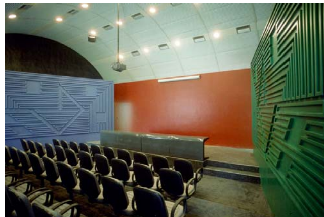
Figura 16: No auditório do TCU-MG, Athos trabalha as fachadas laterais com relevos.

A atuação de Athos tem sido decisiva na maioria dos projetos realizados por Lelé. No hospital Sarah de Belo Horizonte (1997), o arquiteto conta que