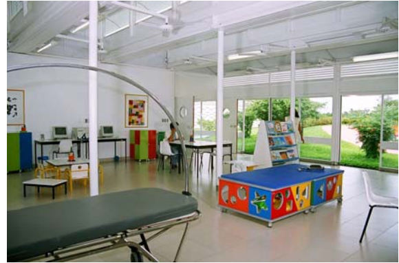
Figura 14: As caixas coloridas do Sarah de Macapá.