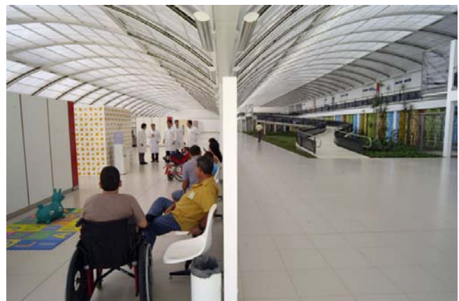
Figura 20: o painel de azulejos (à esquerda) e o painel de argamassa multicolorido (à direita) mostram como Lelé assimilou os ensinamentos de Athos.