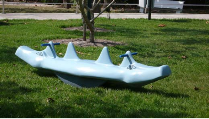
Figura 13: Os animais de Athos distraem as crianças nos hospitais da Rede Sarah.