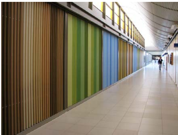
Figura 11: A divisória em lâmina de madeira colorida permite a ventilação entre a fisioterapia e a circulação do Sarah do Lago Norte em Brasília.

A beleza plástica é peculiar no bloco circular, destinado à fisioterapia infantil, cujo espaço é moldado por 64 nervuras dispostas radialmente que se apóiam num anel periférico circular e se lançam para o alto, encontrando um anel central aberto para a extração do ar quente. Neste espaço, os painéis móveis com desenhos geométricos de Athos Bulcão – na realidade divisórias pivotantes, como se fossem bandeirolas, abrindo o espaço para o exterior, integrando-o – proporcionam o lúdico às crianças. Elas se exercitam na parte central do círculo como se ali fosse um picadeiro de circo, banhadas pela luminosidade alegre vinda da clarabóia.