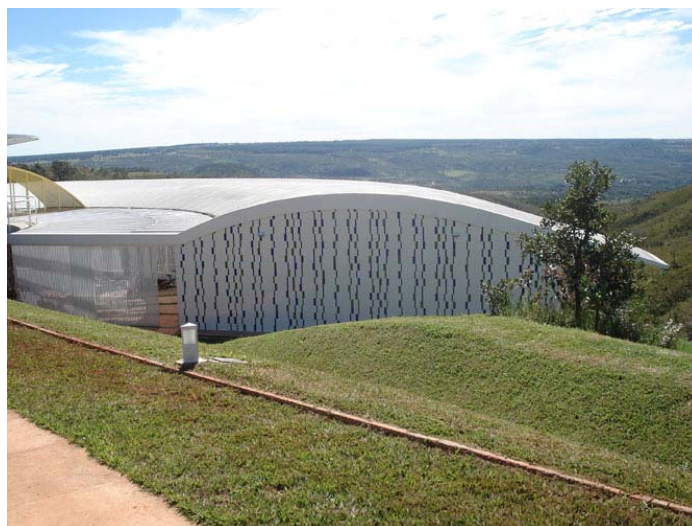
Figura 21: Lelé realça a estrutura com o painel de azulejos que desenha para a residência Roberto Pinho.

Lelé aprendeu muito com Athos, principalmente a função das cores. O branco que predomina em seus projetos sempre é pontuado por elementos em cores fortes, as cores puras, que são o amarelo, o vermelho e o azul. O amarelo é uma cor que afasta o objeto do observador. Assim, em certos elementos do projeto a ser executado, em que se deseja dar esta sensação, como nos castelos de água, Lelé sempre opta por esta cor. Quando há um objeto que deseja valorizar, como a entrada de um edifício ou a cobertura de uma passarela, o vermelho é a cor escolhida. O vermelho mantém o objeto no lugar, mas é uma cor forte. Se utilizada nas marquises, atrai o olhar do visitante, que inconscientemente se dirige para ali, intuindo ser a entrada do edifício. Ao descrever uma pequena casa, elaborada recentemente para um amigo em Salvador, Lelé 18 mostra como foi um bom aluno: a marquise é vermelha, o amarelo usou para o bloquinho que desejava afastar, e a caixa d'água pintou de azul, porque fica próxima do céu.