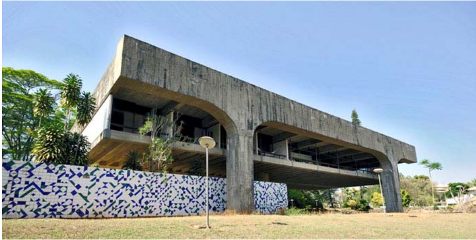
Figura 01: Fachada posterior da Residência José da Silva Neto

até quase o limite do terreno, Lelé amortece a densidade das paredes e reforça o caráter brutalista do projeto, cujo bloco principal é suspenso do solo através de vigas Vierendeel de 30 m de extensão.