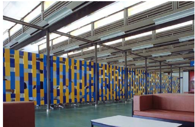
Figura 06: Treliza de ferro pintado em azul e amarelo no Sarah de Salvador.

Lelé ressalta que “ou o arquiteto cria o local para a obra de arte existir ou então é melhor que ela não exista.” 13 Nos hospitais da Rede Sarah, principalmente nos ambientes de circulação e espera, ela está sempre presente. Os painéis se unem para criar biombos que delimitam os ambientes. Coloridos e leves, eles são sempre vazados, originando espaços fluidos. O paciente não se sente oprimido dentro de quatro paredes; ao contrário, encontra solidariedade ao dirigir o olhar pelas fendas criadas propositalmente, entrevedo outros pacientes no ambiente contíguo. Para o hospital Sarah de Salvador (1994), Athos pinta grandes painéis de madeira de azul, rosa, verde e laranja; ou faz deslizar entre si retângulos amarelos e azuis, rendilhando a treliza de ferro pintado com superfícies cheias e vazadas. Athos também pode sugerir o vazio através da pintura. No hospital Sarah do Lago Norte em Brasília (2003), o Yin e o Yang, antiga representação chinesa do dualismo, estão presente no branco e preto com os quais Athos preenche os círculos que furam os painéis azuis que formam o biombo próximo ao auditório. Como a arte deve se integrar à arquitetura, a forma como estão representados – positivo e negativo -, mostra a necessidade de integração entre as duas forças. Yin atrai Yang que atrai Yin, e assim infinitamente. Não há conflito