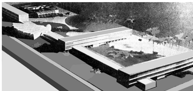
Figura 1 - Instituto de Educação de Pernambuco.

Algumas obras modernas de exemplar qualidade foram incluídas no grupo das obras pré-selecionadas para apreciação por parte da Câmara de Vereadores, como o Instituto de Educação de Pernambuco, dos arquitetos Marcos Domingues e Carlos Correia Lima (figura 1), e os edifícios de apartamentos Acaiaca e Califórnia, de autoria dos arquitetos Delfim Amorim e Acácio Gil Borsoi, respectivamente. Porém, outras obras de significativo valor arquitetônico não foram pré-selecionadas, como o edifício Araguaia, também do arquiteto Amorim, um dos melhores representantes de uma tipologia habitacional bastante comum na cidade, conhecida por 'pilotis mais três', ou seja, três pavimentos sobre pilotis; e o edifício de apartamento Mirage, talvez a primeira edificação projetada por Borsoi a explorar a chamada 'lei das compensações', ou seja, para romper o prisma imposto pelos recuos obrigatórios, o arquiteto propunha a solução de avançar sobre os recuos estabelecidos e compensar esse avanço com igual área na lâmina de construção. Também ficaram ausentes da lista de pré-selecionados os edifícios projetados por Mário Russo para a Universidade Federal de Pernambuco, com especial destaque para a Faculdade de Medicina.